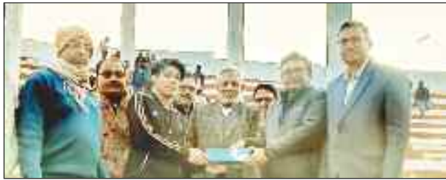
विजेता टीम को पुरस्कृत करते अतिथि।