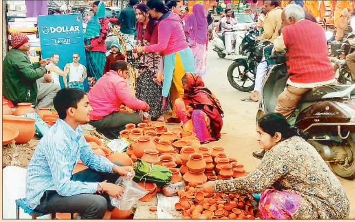
दीये की जमकर हुई बिक्री।