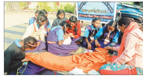
प्रशिक्षण में शामिल बच्चे।

जानकारी के अनुसार हाथियों के दल के द्वारा किसी तरह के नुकसान पहुंचाए जाने की जानकारी नहीं है। बीते 21 जनवरी को आए हाथियों का दल कांदंबारी के जंगल में ही विचरण करते रहे।