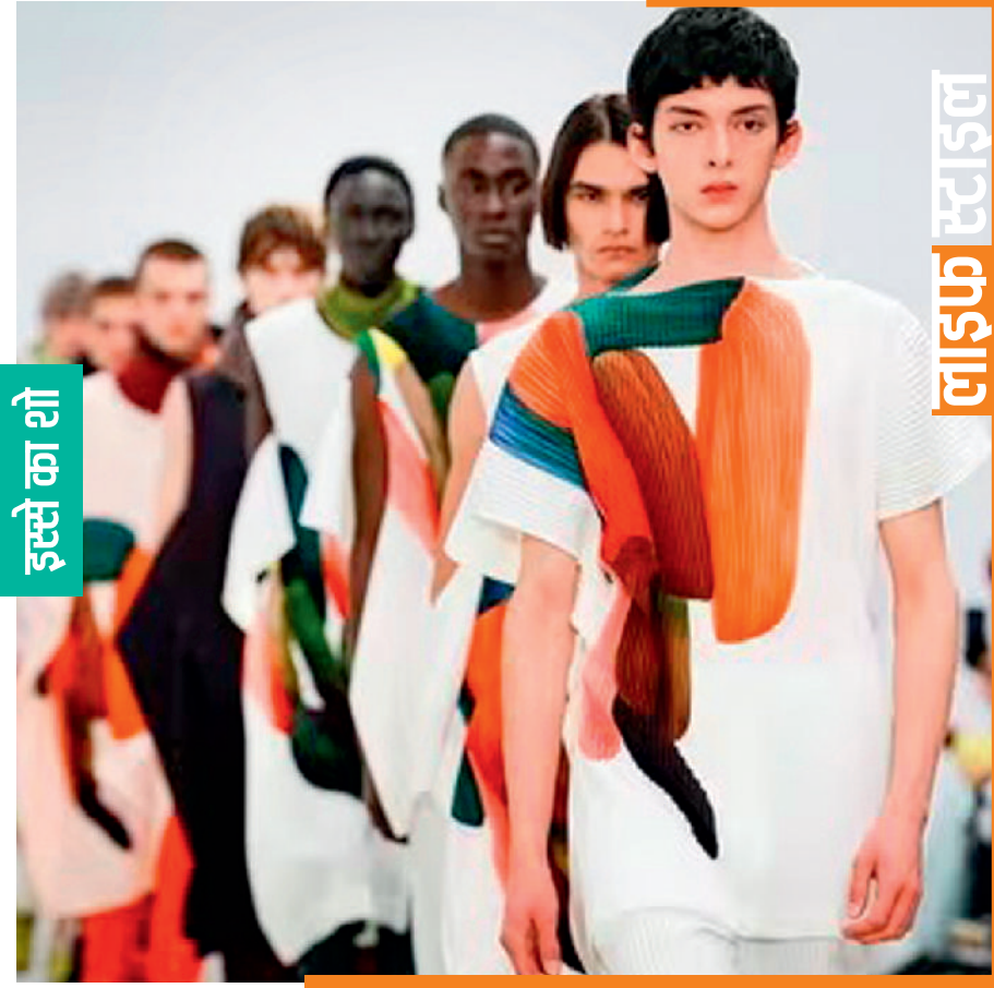
इस्से का शो