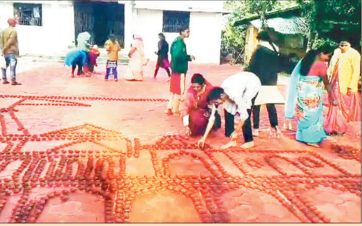
प्रेमाबाग में 11 हजार दीपक प्रज्वलित करने की तैयारी में जुटे लोग।